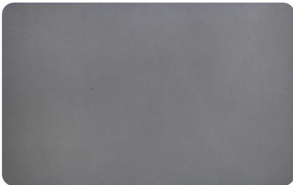
Couleur du film gris foncé