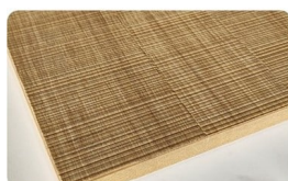
Fuji Chêne - Noyer US