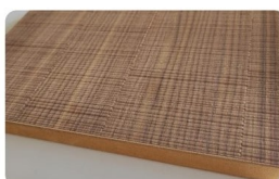
Mojave Chêne - Noyer US